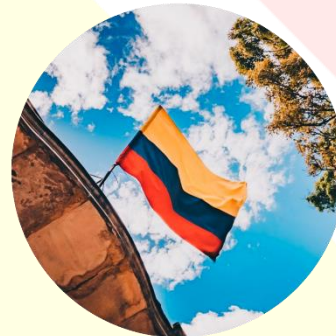
Entre otros lugares del país.